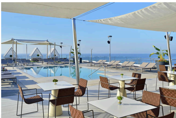
Hotel de Meliá en la Costa del Sol

La Costa del Sol alberga la comunidad británica más grande de España, ahora preocupada por las imprevisibles consecuencias del Brexit . Los alemanes también son fieles a Torremolinos, un destino " con mucho recorrido " que aún no ha despertado el interés de los inversores de manera tan evidente como Benidorm. Eso no quita que grandes cadenas como Meliá estén inmersas en un proceso de renovación de los hoteles, con una inversión de unos 50 millones de euros que se enmarca en el "compromiso con el reposicionamiento de los destinos maduros". Uno de sus principales objetivos es diversificar el perfil de turista "para que repercuta en una mayor rentabilidad del modelo", explican desde la compañía.