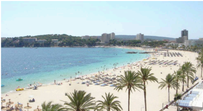
La otra cara de Magaluf.

¿Quién dijo que Benidorm no podía tener glamour? ¿Cuál es la otra cara de Magaluf? Los hoteles de cuatro y cinco estrellas se han lanzado a la piscina con inversiones millonarias allí