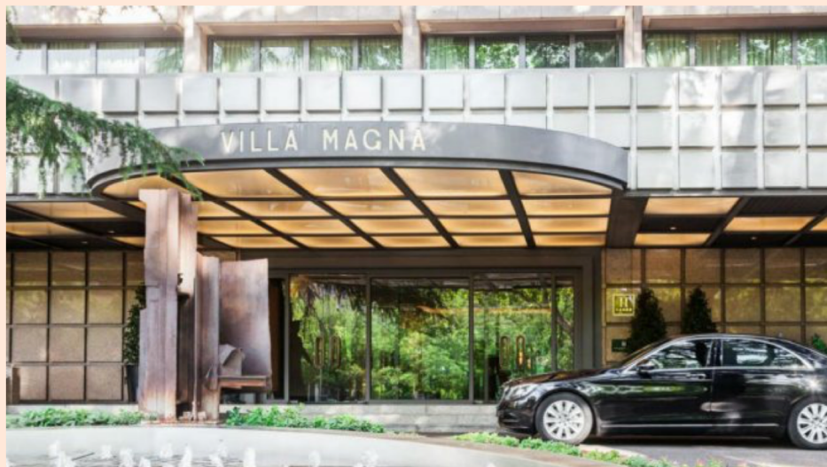
Hotel Villamagna de Madrid